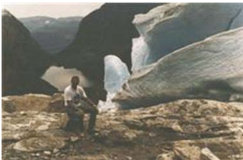
Helt oppe ved Bondehusbræen

Nede fra Maurangerfjorden tager det ca. 2-3 timer at nå op til bræen i ca. 1400 meters højde. Man går igennem en frugtbar dal med en brusende foss, med græssende køer og geder på en rimelig god vej til man når Bondehusvatnet. Der fiskes såvel i elven som i søen. På den anden side af søen begyndte terrænet at blive besværligt, og det sidste stykke op til selve isen var meget svært. De fleste nøjedes med at stå ved foden af fjeldet og se bræen på afstand. Men naturligvis måtte man op og røre ved isen, der knirkede og knagede, og af og til løsrev nogle isblokke sig med nogle gevaldige brag. Vi havde netop denne dag et velsignet vejr med sol det meste af dagen, så det kunne ikke være bedre.