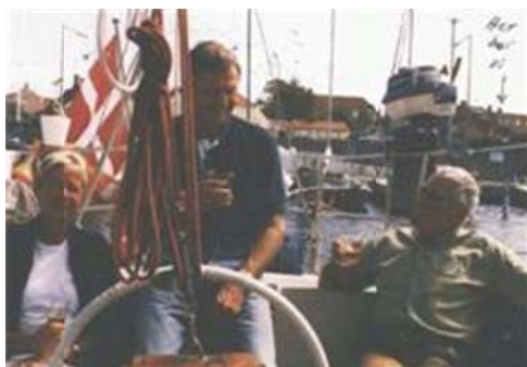
Hjemme igen i Nørrekås Lystbådehavn i Rønne

Fra Skagen krydsede vi sydover hele søndagen. Da vi søndag aften kun var kommet til Læsø rende, og vinden løjede, gik det videre for motor mod Anholt. Denne blev passeret ved 2-tiden om natten så tæt på Stensøre-kysten, at vi kunne røre ved den. Videre passerede vi den tætte trafik fra Storebælt, og om morgenen fik vi øje på Gilleleje. Videre med Kronborg om styrbord igen - i regn ned gennem Sundet - og endelig sidst på eftermiddagen i Lynetten. En dejlig havn med en elendig beliggenhed. Op tidligt næste morgen, hvorefter kursen gik mod Falsterbo. Ved Trelleborg kunne vi atter sætte sejl, og på de sidste 50 sm fik vi en af turens bedste sejlads og så oven i købet i solskin. Vi løb ind i Rønnes lystbådehavn, Nørrekås kl. 20. Vi havde sejlet 1.240 sømil og været 39 dage undervejs.