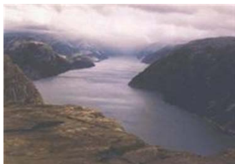
Lysefjord set fra Predikestolen.

Dette er en tur, som man ikke må springe over, dersom man kommer på disse kanter. Det blæste så voldsomt, at vi nærmest måtte klamre os til klipperne, men det var en fantastisk oplevelse at stå på en klippe, der går 600 meter lodret ned mod fjorden. I det hele taget er udsigten ud over Lysefjorden, hvorpå vi havde sejlet dagen før, et betagende syn.