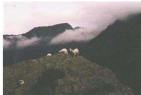
Geder helt oppe i skyerne

Om aftenen grillede vi nogle fisk, som campisterne havde fanget i fjorden, og næste dag startede vi så hjemturen. Vi lagde turen ind om Rosendal for at proviantere, idet der ikke fandtes meget at købe i Sunndal. Videre ud af Hardangerfjorden - planen var at nå helt til Haugesund, men det var for stor en mundfuld. Vi så på søkortet, og en lille beskyttet naturhavn kaldet Bømla blev udvalgt.